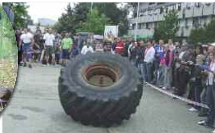
Az Erős emberek szlovák bajnokságán ezt a 450 kg-os monstorumot is háromszor kellett átfordítaniuk a versenyzőknek