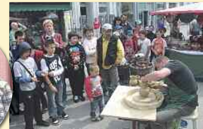
Bemutató a Kézművesek utcájában