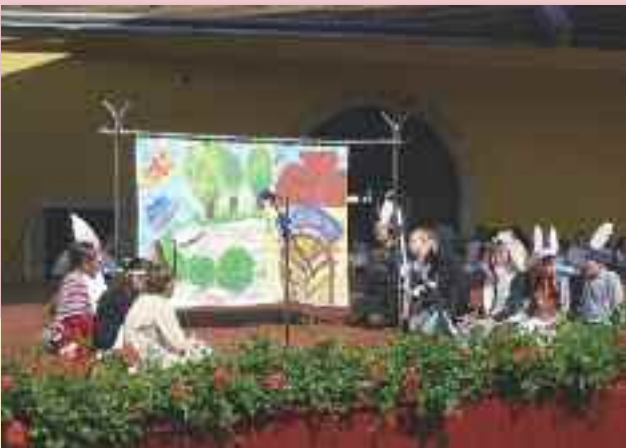
„Helló Európa” - a Tiszti pavilon szabadtéri színpadán felléptek a komáromi alapiskolások