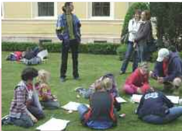
Gyerekek rajzversenye a művészetek kertjében