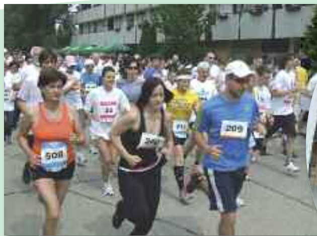
A XXXVII. Komárno–Komárom nemzetközi utcai futóversenyen több mint 400-an álltak rajtához