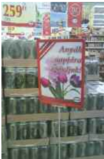
Nincs is szebb ajándék ☺

- Az én kutyám a legokosabb a világon - dicsekszik egyik vadász a másikkal.