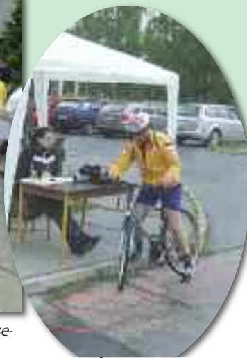
A IX. Csárda túrán mintegy 250 kerékpáros vett részt