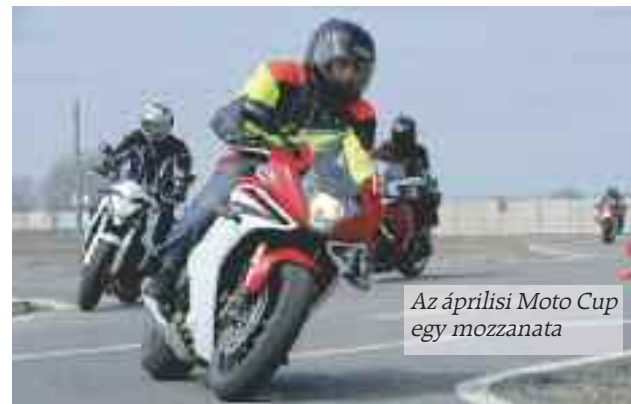
Az áprilisi Moto Cup egy mozzanata