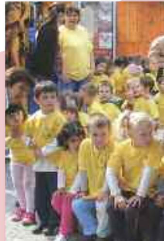
Az oviolimpia futóversenye 15. alkalommal került megrendezésre