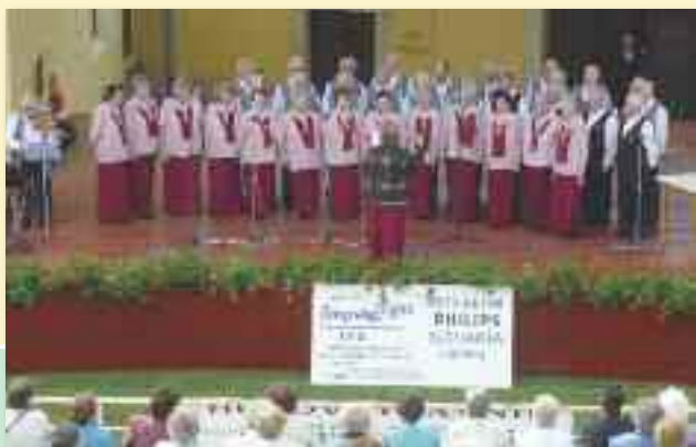
A komáromi és a magyarországi Kék Balaton nyugdíjasainak műsora a Tiszti pavilon színpadán