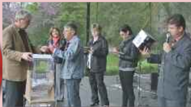
A Pepita tours, Šeko shop, Sitno és a DELTA hetilap nagy tavaszi nyereményjátékának sorsolása