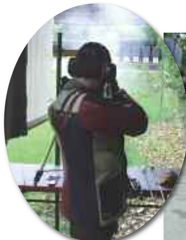
A XVI. Klapka Kupán eldőrdültek a történelmi fegyverek