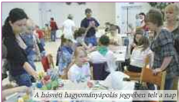
A húsvéti hagyományápolás jegyében telt a nap

A gyerekeknek szánt akci- juk lebonyolítását, szervez- ését idén a városi baba-mama- klub, a nagymegyeri Manó- ház is segítette. A néphagy- ományokat ápoló esemény helyszíne a művelődési ott-