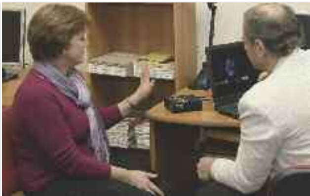
Az aurafotó olyan egyedi, mint az ujjlenyomat, amiből nemcsak a múlt olvasható ki, de utalhat a jövőnkre is