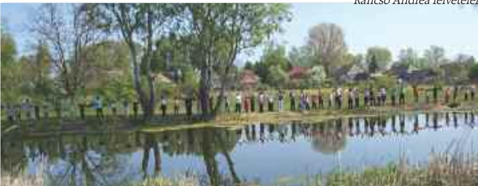
Élőlánc a Hetényi tó körül, ezzel hívták fel a figyelmet a tó megóvásának fontosságára