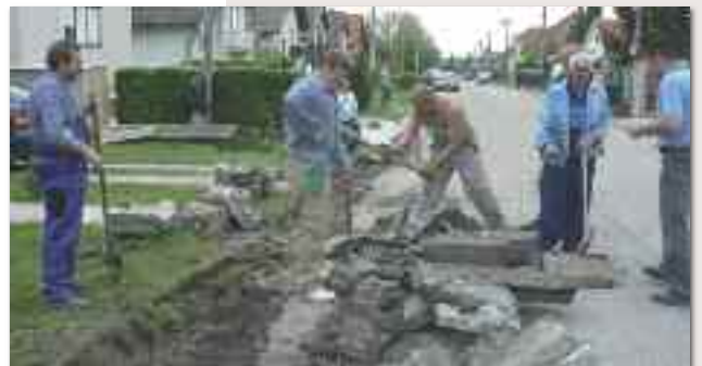
„Ez férfimunka volt!”

A foci pálya környékén is serényen munkálkodtak. Ottjártunkkor ép a májusfának leginkább megfelelő jegenyét kényeszerítették „térdre”. A komposztálóhoz közel egy kisebb tónak készítették helyet, ahová a felesleges esővíz majd utat találhat. Egy picit arrébb a nyugdíjasok egy csoportja tölgyfákat ültetett. Alig tettünk meg néhány lépést, máris komoly, fizikailag is megerőltető munkába „botlottunk”. Az egyik utcában ugyan csak a vízelvezetést szolgáló árokrendszert tették használhatóvá, egyesek viszont a házuk előtt sertepeltették, tartva magukat a mondáshoz, hogy ha a háza előtt mindenki összesöpör, ezáltal az egész utca tiszta lesz. S tartva magukat a községi brigád jelszavához: Tiszta falu - tiszta porta.