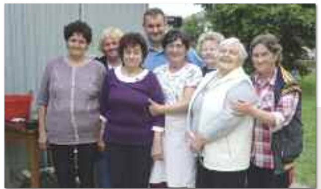
A SZISZETA tagjai főzték a falugulyást

Megmozdult a falu. Szombaton mindenki szorgoskodott. Láthatóan tenni akartak ezért a kis takaros településért. A faluszépítés a község különböző területein folyt, így például a felújított játszótéren, ahol a szorgos kezű asszonyok és lányok a padokat, a hintákat és a mászókat „varázsolták” át.