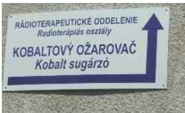
Egyik a két általunk felfedezett kétnyelvű táblából. Igaz, nem felel meg a magyar helyesírás szabályainak, de legalább van