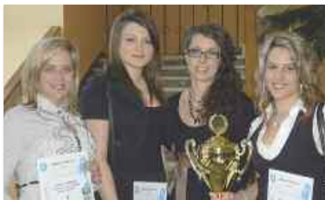
A teremkerékpáros szakosztály felnőtt női négyes csapata

2. A teremkerékpáros szakosztály felnőtt női négyes