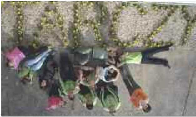
A kilencedikesek virágokat ültettek Tarczy felirattal