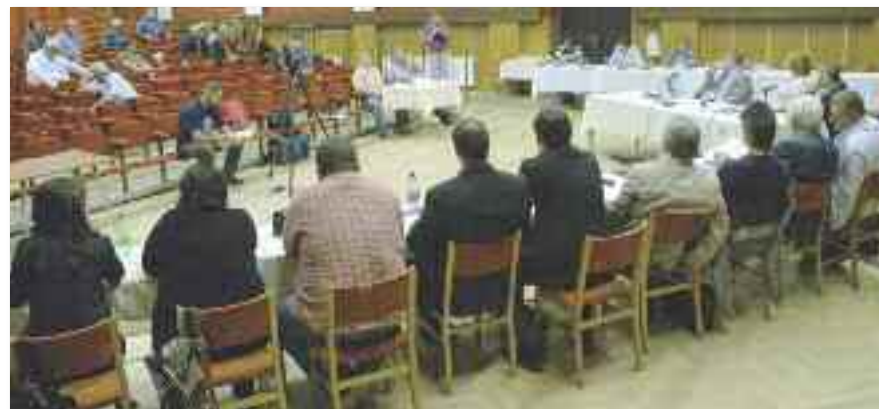
Plénium után fórum következett