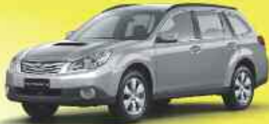
4x4 SUBARU Outback 2.0 D VA