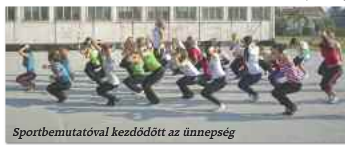
Sportbemutatóval kezdődött az ünnepség