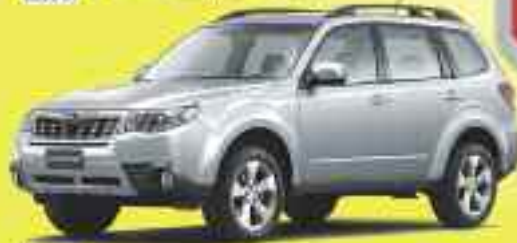
4x4 SUBARU Forester 2.0 X, 2.0 D XS