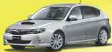
4x4 SUBARU Impreza 1.5 R

Egyes Subaru modelljeink most ÁFA nélkül elérhetőek