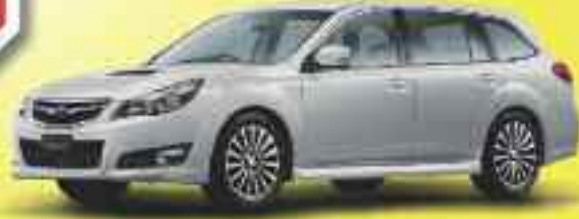
4x4 SUBARU Legacy 2.0 DT.W.VA