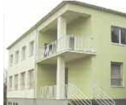
Átépítésre kerül az egykori óvoda

„A takarékosági intézkedéseknek köszönhetően 2013-ra újra hitelképesse vált a község, így lehetőség nyílt olyan befektetések megvalósítására, amelyek gyorsan megtérülnek, és hosszú távon is megtakarítást jelentenek. A képviselő-testületben több ülésen is megvitattuk a lehetőségeket, majd egyhangú szavazással négy beruházást választottunk ki, összesen mintegy 170.000 euró értékben: a közvilágítás teljes cseréje LED - lámpákra, a fűtésrendszer modernizációja az alapiskola és a községháza épületében, az óvoda átköltöztetése egy kisebb, gazdaságosabb épületbe, valamint az kultúrház és a tornater-